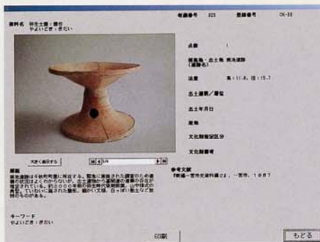
収蔵品の解説画面

収蔵資料の中から、考古資料450点・民俗資料200点・歴史・美術資料100点・行政資料340点、計1,090点の情報を公開します。キーワードや分類（考古資料だったら、縄文時代・土製品や石製品など）で資料を検索、見つかったものの写真もご覧になれます。