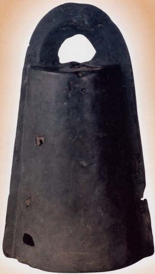
「八王子遺跡出土銅鐺」