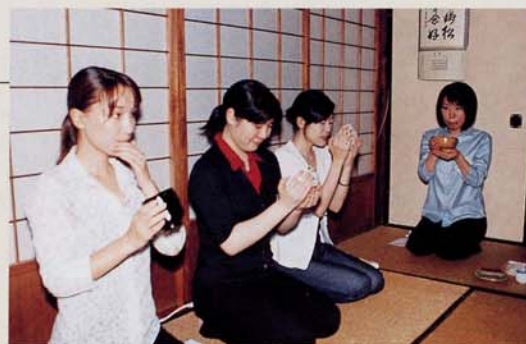
茶道の作法体験 (担当 毛受・岩井)

歴史・美術部門では、茶道の作法体験、美術品の取扱や写真撮影、行政文書の整理など、多岐に渡る内容を企画しました。限られた時間でしたので、どうしても広く浅くになってしまいがちでしたが、実習生皆さんは、どの作業においても、新鮮な気持ちで一糸懸命取り組んでくれました。これからもがんばってほしいものです。