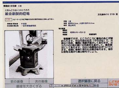
文化財の解説画面

一宮市内で、国・県・市の指定を受けている文化財189点を紹介します。文化財を、地域や種類（建造物・絵画・彫刻など）・時代から選ぶことができます。詳しい内容の大人用解説や、子ども向けの解説、写真等がご覧になれます。