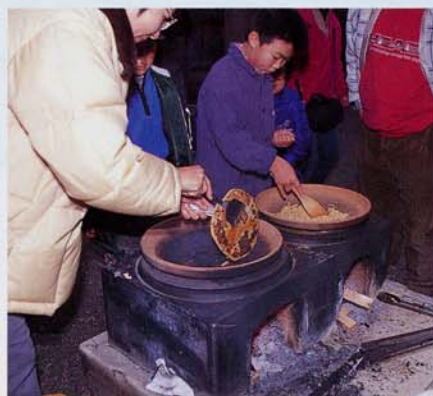
センバヤキのお味はいかが? (2001年1月7日)

今年で11回目になる、歴史を初めて学び始める小学校3年生を対象にした展示。来年からは小学校4年生のカリキュラムに変わるので、3年生のための最後の年となる。着物や下駄、ワラゾウリ、マンガや備中鍬といった農具などを展示し、今から70年ほど前のくらしの様子を、道具を通じて子どもたちに紹介します。