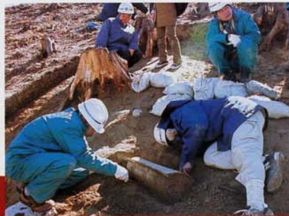
西の谷 (敷地3号)銅鐸

1989年に、愛知県清洲町・朝日遺跡で、鐸を上に向けて横向きに埋納された銅鐸が発見された。こうした埋納方法は、各地で出土する銅鐸に共通するものがある。