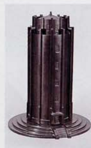
配水塔模型 昭和10年頃夏の企画展「一宮市制80周年回顧展」より