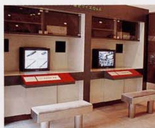
歴史クイズQ & A