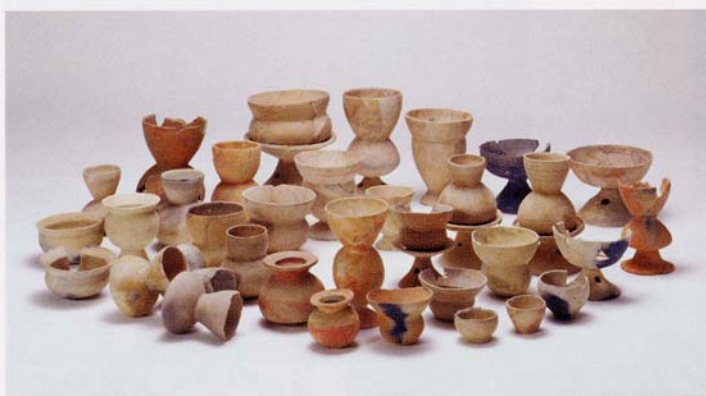
井泉周辺 出土土器群