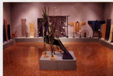
手つむぎ・染め・織り展(15年度)

繊維講座(下記参照)の生徒と卒業生(伝承会員)による、16回目の作品発表会。手つむぎ・染色・機織りなど多くの工程を経て製作された木綿の作品を展示します。