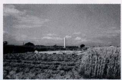
荻安賀城跡(1960年撮影)