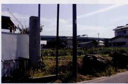
蔵骨器出土地近景

①の蔵骨器中に火葬人骨とともに、②の山茶椀の小片一点が遺存しており、この蔵骨器の蓋として利用されていたものと推定した。 ①の四耳壺は古瀬戸前期の産と推定され、十三世紀前半代に、②の山茶椀は十三世紀後半代にそれぞれ編年されており、遅くとも十三世紀のうちにこの蔵骨器が埋納されたと考えられよう。 荻安賀城跡は、現在は削平され、荻安賀自動車学校用地となっているが、この蔵骨器が出土した地点は、城跡と考えられる高まりの西南隅にあたる。 荻安賀城は、戦国期浅井新八・田宮丸父子の居城であったと伝えられており、築城は永祿初年(一五五八)の頃を遡らないとする。今回紹介した蔵骨器は、この荻安賀城築城の時期を遡るものであり、築城以前にこの地に中世墓が営まれていたものと考えられる。その後荻安賀城築城にあたりこの中世墓の区域がどのように扱われたのかはつきりしないが、この畑の東半が固く締まっているという話から、東半は荻安賀城築城に伴う整地層と推定されよう。これに比して、西半が軟質で礫層まで簡単に掘削可能であるということは、この中世墓は、築城に際しての工事区域から除外されやがて埋没したという可能性も指摘できよう。