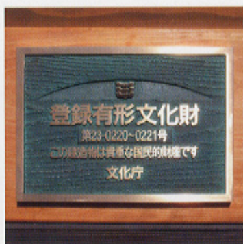
▲上のプレートは、木曾川資料館主屋・木曾川資料館収蔵室のもの。

昨年度に文化財登録を申請していた各三棟の建造物が平成18年8月3日付けで文化財登録原簿に登録され、文化庁よりプレートが交付された。