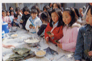
▲ホウバメシを味わう

山のくらしを体験！ 木曾川上流に暮らす人々の暮らしぶりや自然について学び、エゴマの味のするゴヘイモチやホウバで包んだホウバメシを味わいました。