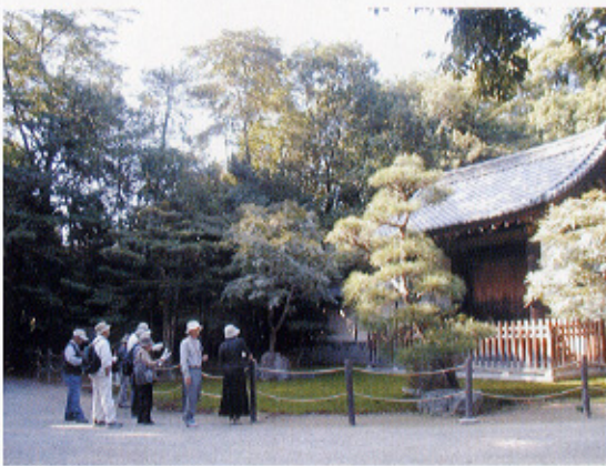
▲妙興寺勅使門前での解説

また、本講座の修了生の活動として、博物館に隣接し愛知県指定史跡でもある妙興寺境内地を案内する活動を、特別展・企画展などを開催中の土・日曜日に実施しました。文化財解説ボランティア講座修了生の方々に協力いただき、午前中は1時からの1回、午後は1時30分と2時30分からの2回、概ね30分間ずつ、希望者に対して解説活動を行ってまいりました。