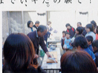
▲海の暮らしを体験

海のくらしを体験！ 海のくらしについて話を聞き、食を体験するとともに、平野の暮らしと比較しました。ゴンドウ汁にはスズキをさばいて入れもらい、日ごろ味わうことのできない味を体験しました。また、漁業や、日間賀島の暮らしについて学びました。