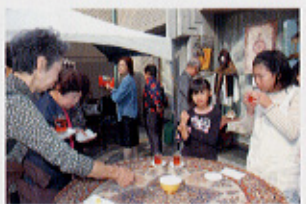
▲世界のティーパーティー

平成18年10月21日～11月12日 企画展 第6回川合玉堂展 玉堂—その「うた」