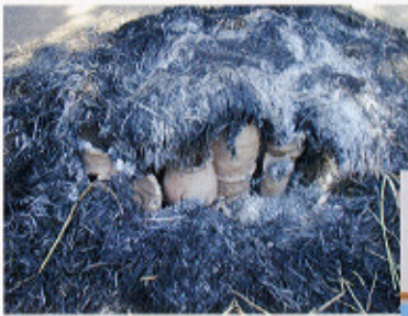
▲うまく焼けたかな