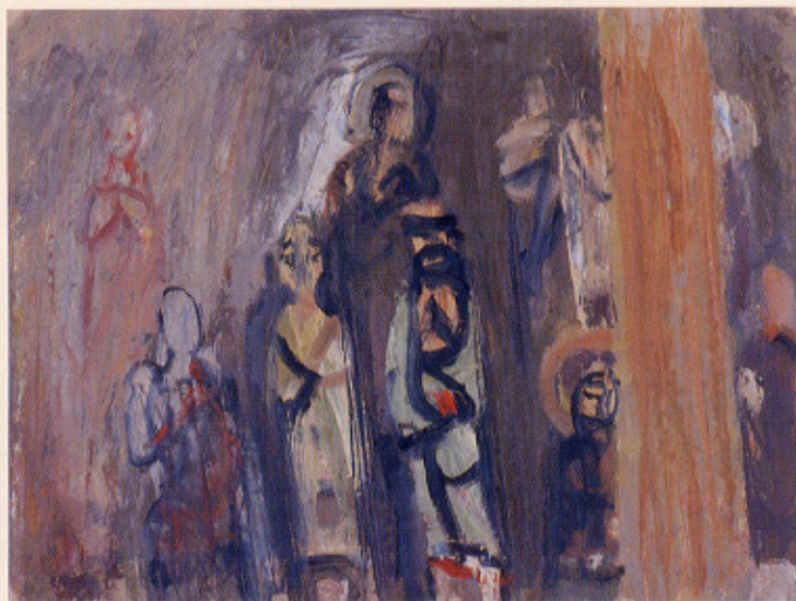
杉本健吉 五百羅漢 1944年