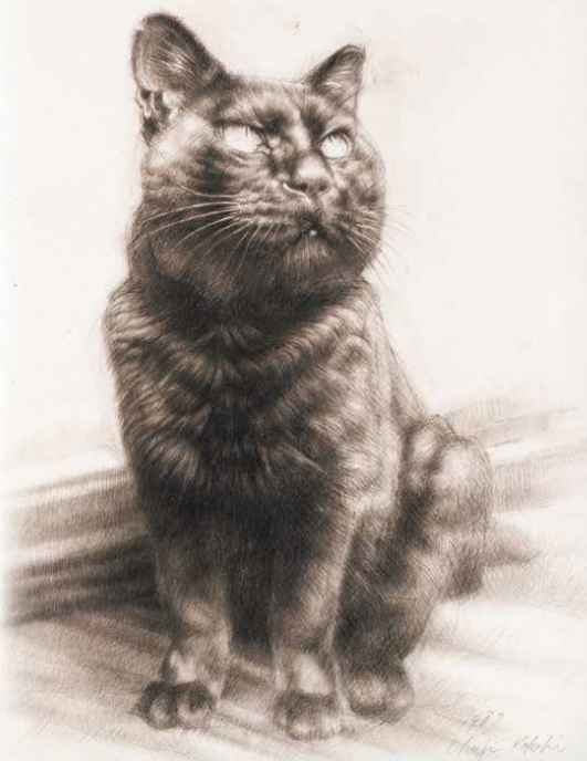
鏡忠治<ノラ11>(所蔵品による企画展「鏡忠治」)