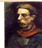
赤いマフラーの男