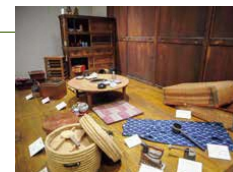
くらしの道具 2020年度