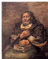
虫眼鏡を持てる老母

一宮市萩原町出身で孤高の洋画家と呼ばれた算忠治(1908-2004)の自画像、ノラシリーズ、花の連作、そして10年にわたって母を描いた大作など、所蔵品の中から代表作を紹介します。