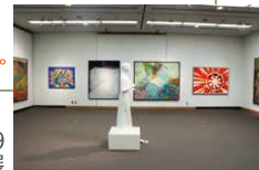
2019 一宮市現代作家美術秀選展