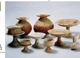
北川田遺跡出土品