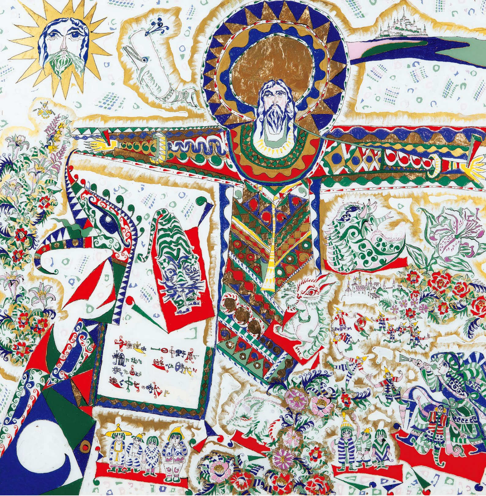
堀尾一郎〈ヨーロッパ中世の方船〉