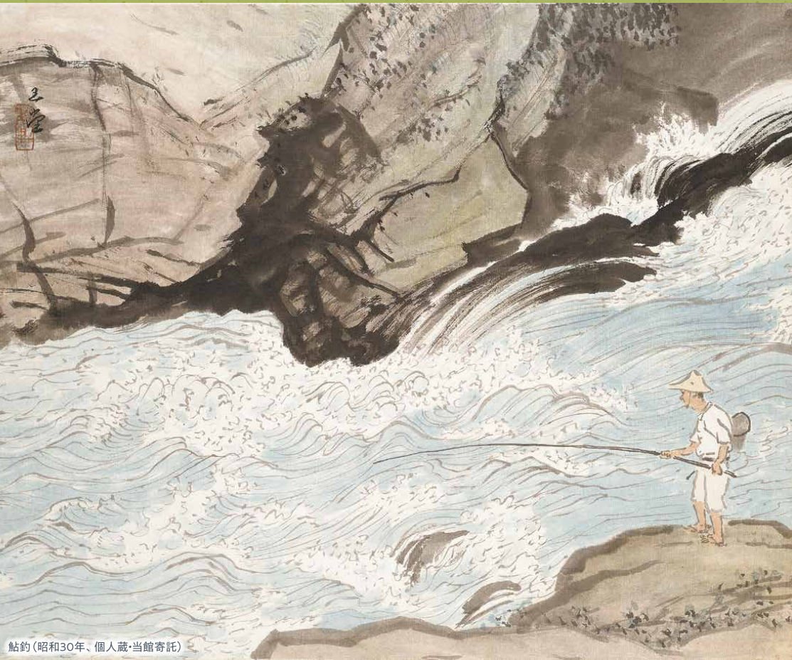
鮎釣(昭和30年、個人蔵・当館寄託)