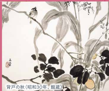
背戸の秋(昭和30年、館蔵)