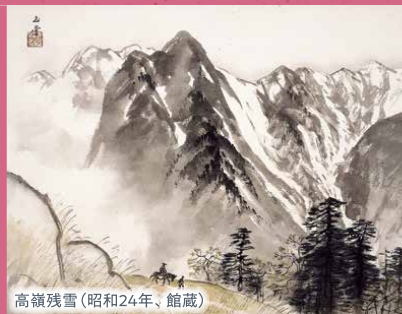
高嶺残雪(昭和24年、館蔵)