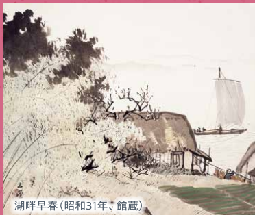
湖畔早春(昭和31年、館蔵)