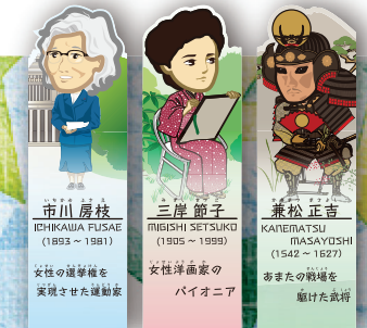
三宮 厚枝 ICHIKAWA THUSAE (1893～1981)

開館時間 博物館: 午前9時30分～午後5時 資料館・美術館: 午前9時～午後5時 ※入館は午後4時 30 分まで