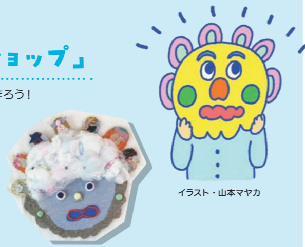
イラスト・山本マヤカ

7月1日(土)午前10時から7月28日(金)午後5時までに博物館Webサイトにある申込フォームから申込。詳細等は、後日メールにて送信。1通につき1家族まで応募可能。